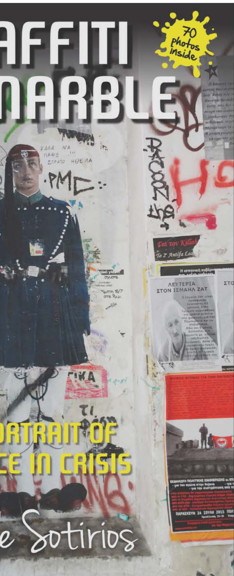
Το βιβλίο του Jorge Sotirios «Graffiti over Marble – A Portrait of Greece in Crisis» κυκλοφορεί από τις εκδόσεις InHouse Publishing.

στιγμή, αποτέλεσμα μιας συνειδητής απόφασης, αποτυγχάνει να την συνδέσει με μια ιδεατή εικόνα της. Αυτή ακριβώς η αποτυχία είναι η δεύτερη μεγάλη αρετή του βιβλίου του. Η αλλιώς, με τα δικά του λόγια: