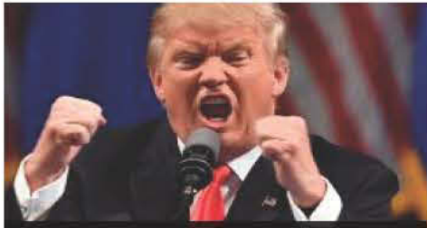
Ο ΤΡΑΜΠ σε τράμπολ, το ίδιο κι δικός ο Μόρρισον, λόγω αντιπολιτευτικής ισχυροποίησης, μόνο του... Τσίπρα τ' αυτί δεν ιδρώνει